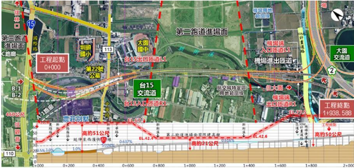
圖 2 甲優先路段(大園交流道至大園區臺 15 線)路線圖