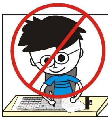
請勿拍攝考生個人特寫